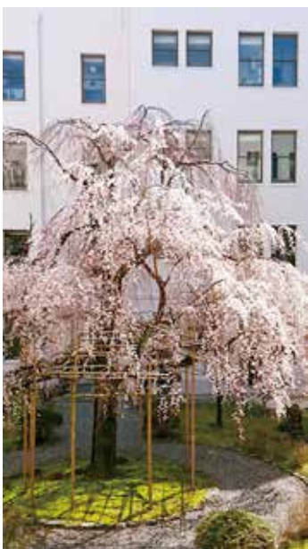
県庁中庭のしだれ桜 いつ頃、どの様な経緯で植えられたか調査中とのことです。