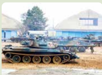
ライオンマークの第3戦車大隊の戦車(写真は12/4今津駐屯地創立70周年記念行事訓練展示より)