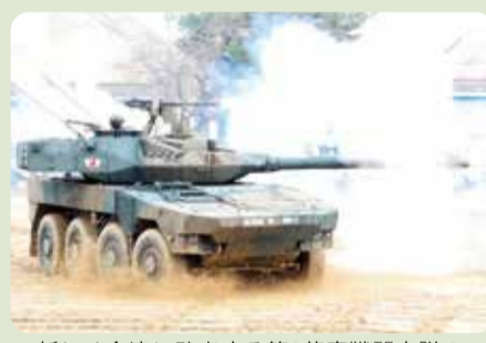
新しく今津に駐屯する第3偵察戦闘大隊の8輪機動戦闘車

第3偵察戦闘大隊の8輪タイヤ型機動戦闘車は、時速100kmで走行できるので、機動力を発揮するための国道161号線の改良整備は国防上の重要課題です。自民党滋賀県連の政務調査会からも国に対し、国道161号線の整備促進を強く働きかけます。