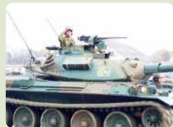
シャチホコマークの第10戦車大隊の戦車

70年の歴史を重ねてきた、陸上自衛隊今津駐屯地の第3戦車大隊は、令和4年度中に戦車から8輪タイヤで時速100kmで展開できる偵察戦闘大隊へ改編・増員されます。