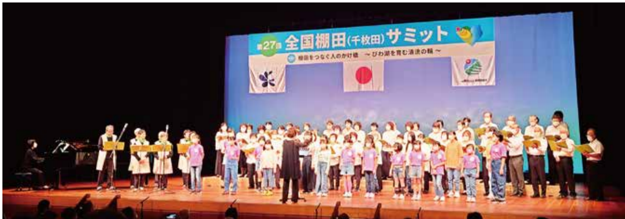
第27回全国棚田サミットが、「棚田をつなぐ人の架け橋〜びわ湖を育む清流の輪〜」をテーマに10月1・2日に高島市で開催されました。経済効率だけで計れない、国土を保全し、地球環境を守り、人の繋がりを結ぶ仕組みを応援していきたいものです。写真は開会式のオープニング演奏(演劇集団つばめ、高島少年少女合唱団、マキノ少年少女合唱団、どれみふぁ倶楽部、混声合唱団コーロいまづ、湖西高島「命の第九」を歌う会、グリーンハーモニー、ほほえみコーラス、ふじコーラス、針江よし笛の会の皆さん (R4.10.1)

〒520-1501 高島市新旭町旭1-8-5 電話 0740-25-0777 FAX 0740-25-0778 Mail: web_info@hi-kaito.com ホームページ http://hi-kaito.com