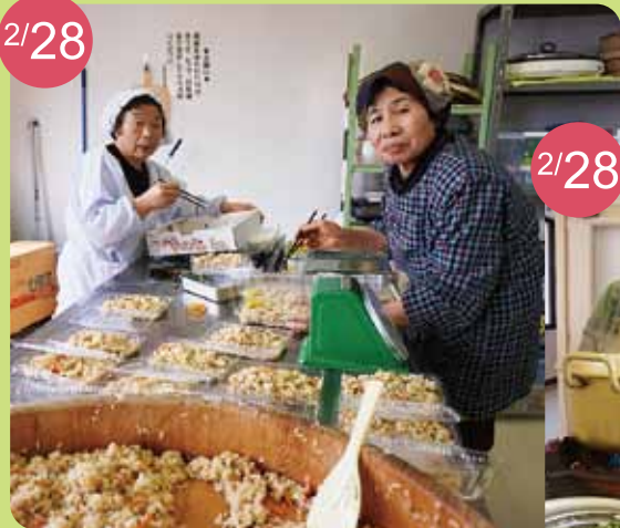
世代交流センターフェスティバル 炊き込みご飯名人