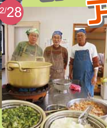
男の賄い教室 そば名人