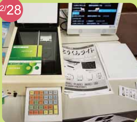
視覚障がい者福祉機器展(彦根ビバシティ) 小説や郵便局の通帳も読んでくれる