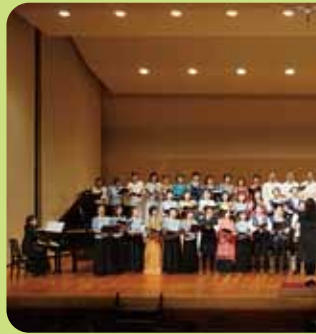
高島市民音楽祭「響」 心を合わせて「花は咲く」