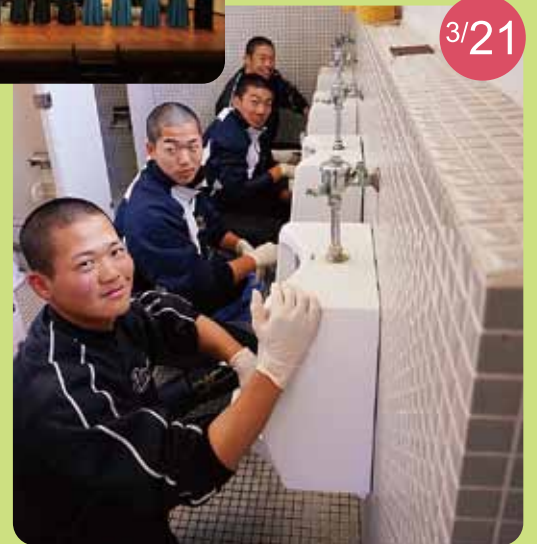
第72回高島掃除に学ぶ会 安曇川高校野球部・女子バスケ部も参加